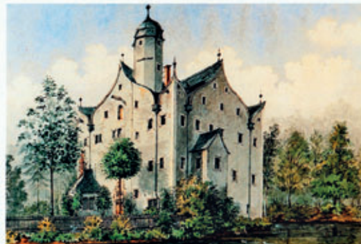
Geschichtsverein Klaffenbach e.V.