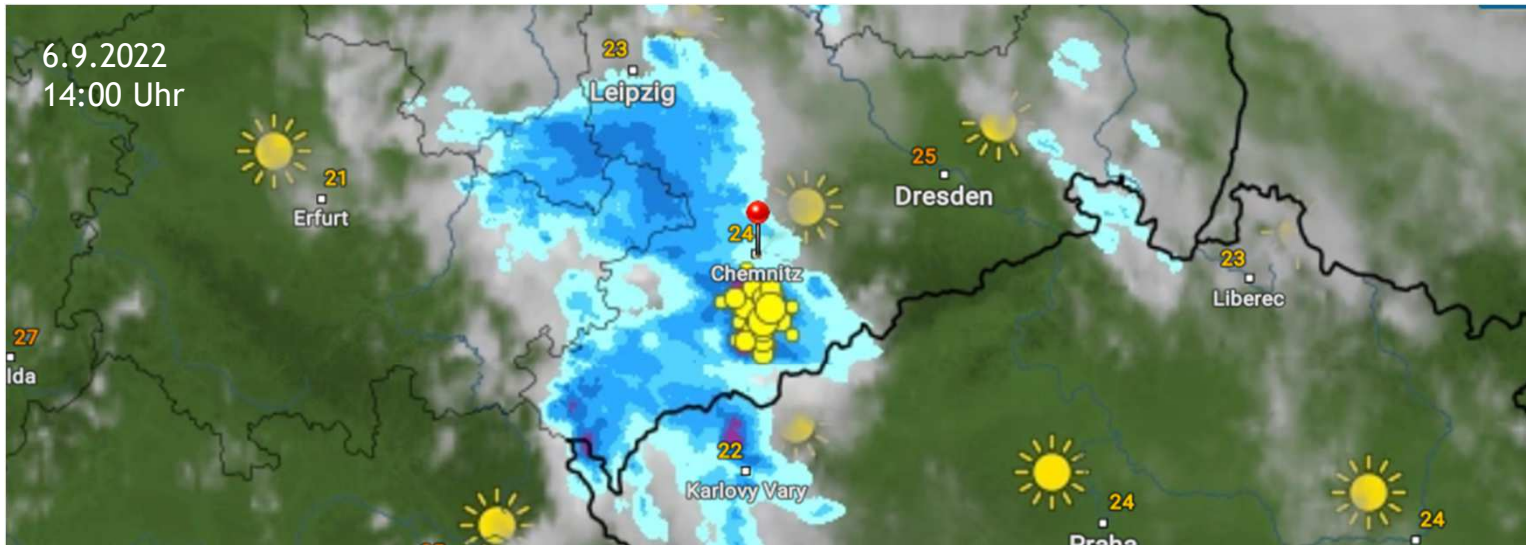
Niederschlag Amtsberg-Weißbach (N) (27.08.2022 bis 09.09.2022)