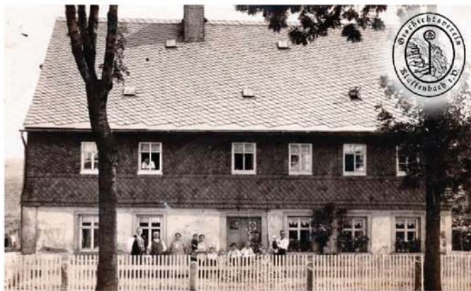
Ansicht um 1936 – der Weg umbenannt in Horst Wessel-Weg – erste bauliche Veränderungen sind erkennbar.

Ansicht, vermutlich Anfang der 20er Jahre aufgenommen.