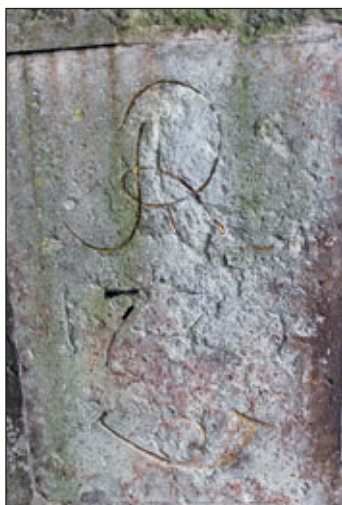
Detail der Beschriftung vor der Restaurierung