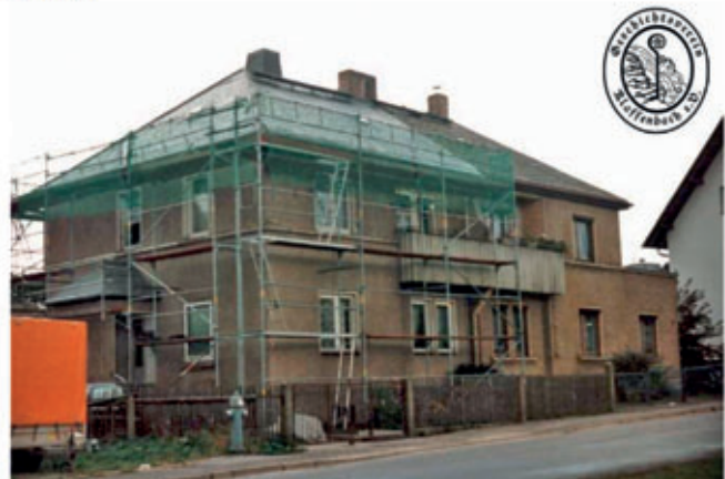
Ansicht um 1995 und Heute

Die Wäschemangel existierte noch bis in die 90er Jahre. Ab 1990 betrieb die Familie mehrere Jahre einen Getränkehandel.