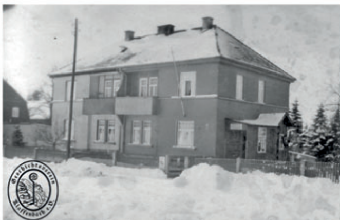
Das gesuchte Gebäude aus dem letzten Anzeiger war das Doppelhaus Chemnitzer Straße 8/9

Erste Aufnahmen des Gebäudes existieren seit dem Ende der 1920er Jahre