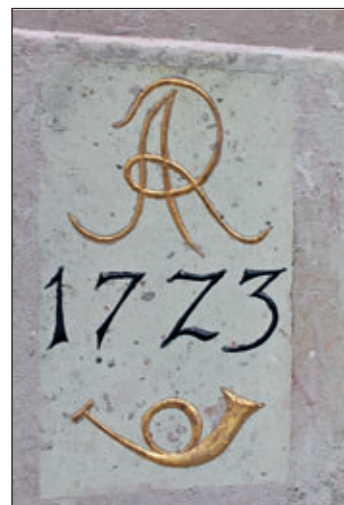
Detail der Beschriftung nach der Restaurierung