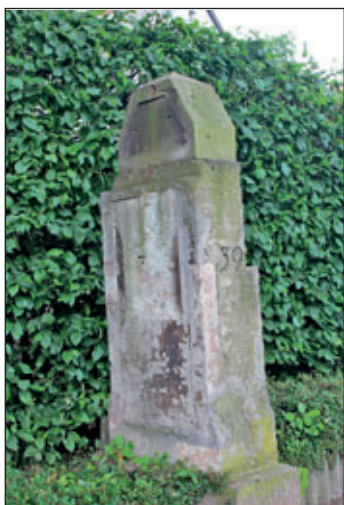
Gesamtansicht des Steins aus Richtung Grundschule vor der Restaurierung