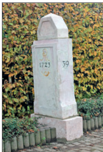
Gesamtansicht nach der Restaurierung