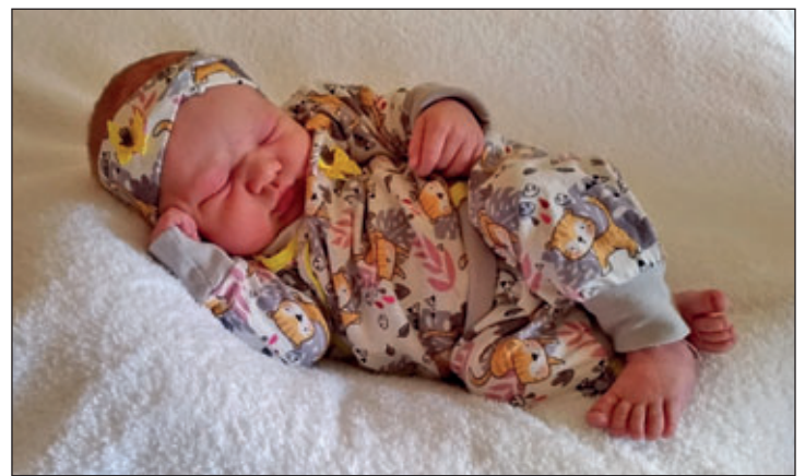
Wrobel, Feyru Inette