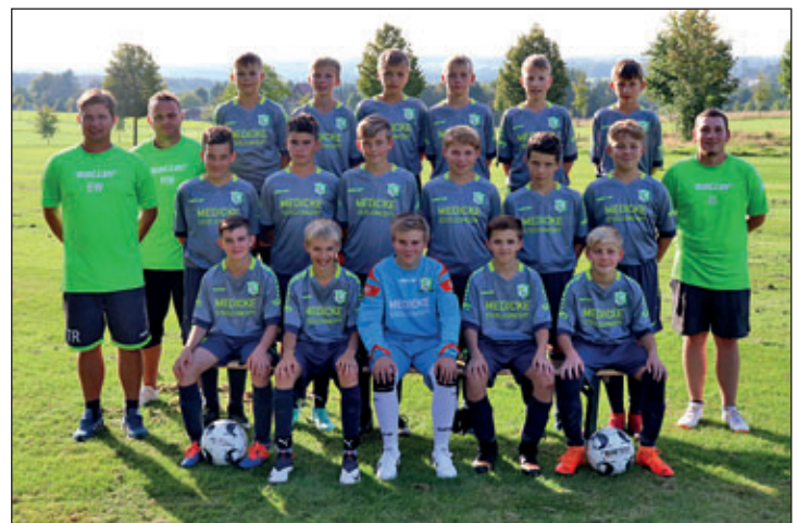
Autor: Diana Konieczny

Anzeigentelefon für gewerbliche und private Anzeigen Telefon: (037208) 876-0