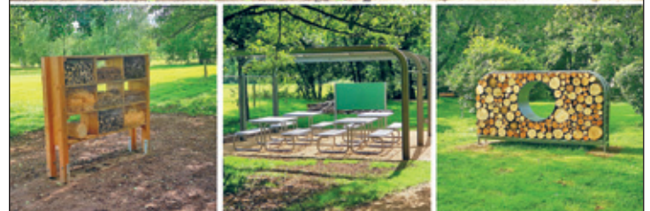
Wiedereröffnung des sanierten Kulturparkes am Reiterhof

Impressum: Klaffenbacher Anzeiger – Bürgerzeitung mit Informationen aus dem Ortschaftsrat • Herausgeber: Riedel GmbH & Co. KG, Verlag für Kommunal- und Bürgerzeitungen Mitteldeutschland, verantwortlich: Hannes Riedel • Verantwortlich für die Informationen aus dem Ortschaftsrat: Ortsvorsteher Andreas Stoppke, Lokaler Ansprechpartner: Andreas Stoppke, Telefon 0371-2607017. Für den Inhalt der Beiträge aus den Vereinen bzw. sonstigen Einrichtungen sind die Autoren der Beiträge verantwortlich. Wir bitten die Textbeiträge möglichst in digitaler Form zu übergeben und zur Kontrolle noch einen Ausdruck oder PDF-Datei dazuzulegen. v.i.S.d.P: Hannes Riedel • Anzeigen und Gesamtherstellung: Riedel GmbH & Co. KG, Verlag für Kommunal- und Bürgerzeitungen Mitteldeutschland, verantwortlich: Hannes Riedel • Auflage: 1.225 Exemplare, Erscheint einmal im Quartal kostenfrei. E-Paper auf der Homepage des Verlages: www.riedel-verlag.de. Es besteht kein Anspruch auf Veröffentlichung eingereicherter Beiträge. Es gelten die Mediadaten des Verlages (Stand: 2024)