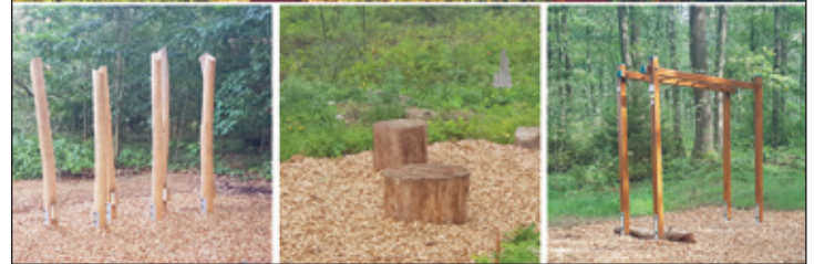
Trimm-Dich-Pfad im Tiergartenwald am Schwemmtsch