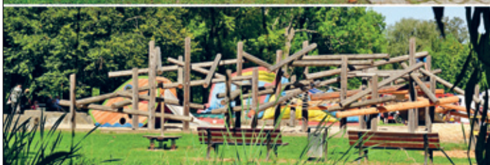
Wiedereröffnung des Spielplatzes am Wasserschloss